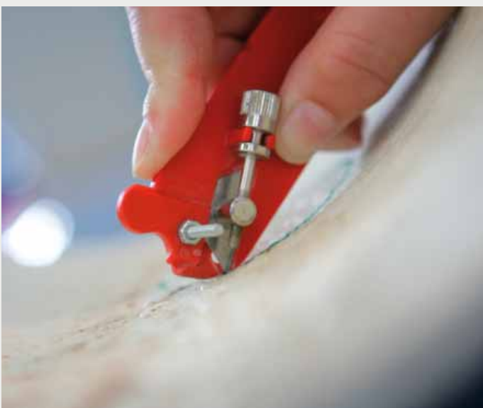
Afbeelding 2: Insnijden van de binnenfolie met begrenzing van de diepte van de snede