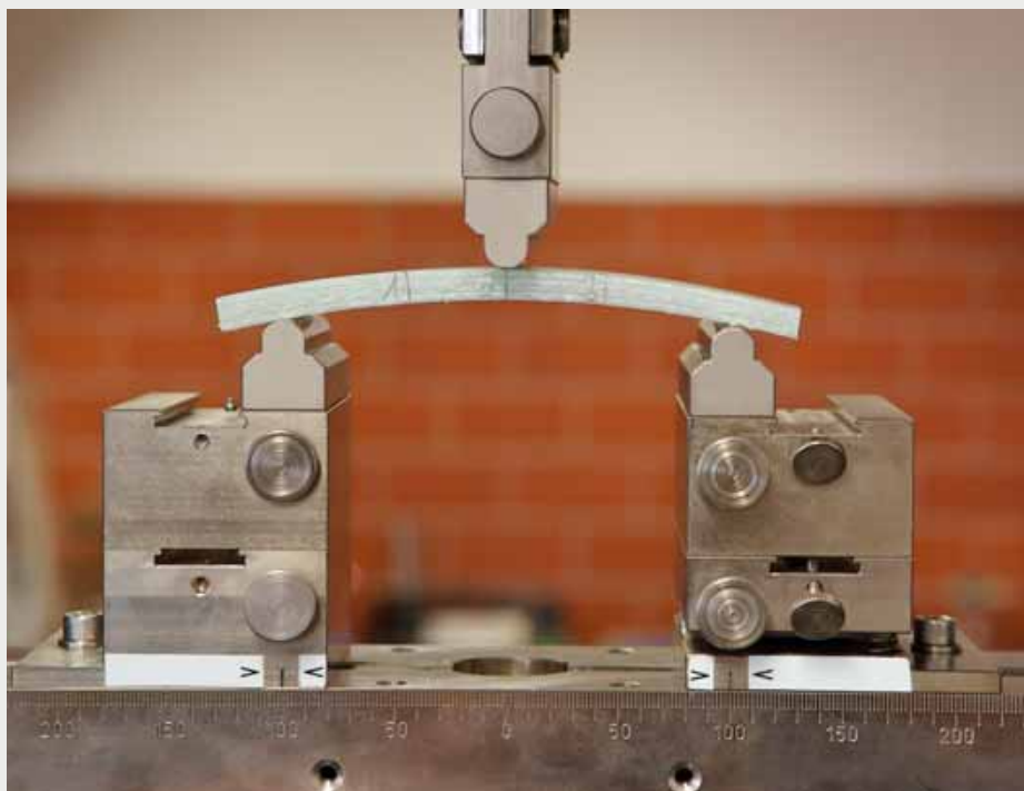
Afbeelding 1: Liner-monster in de driepuntsbuigpoging