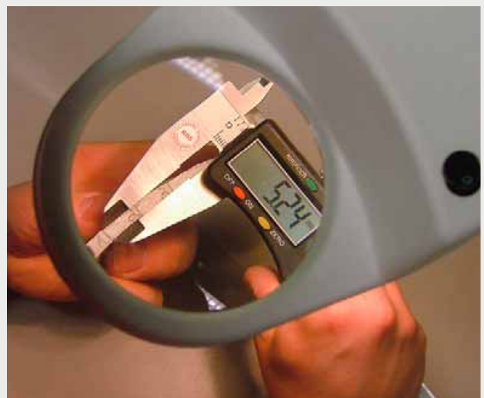
Afbeelding 3: Meting van de liner-wanddikte